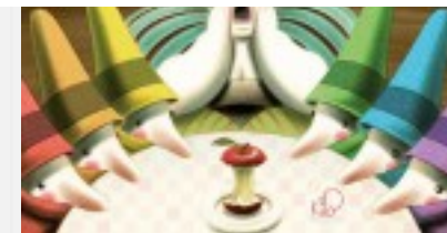
Il mistero delle fiabe divorate

“Condividere i segreti è il miglior modo per evitare il mal di pancia“. Ecco a voi il primo libro che spiega gli effetti psicosomatici dello stress