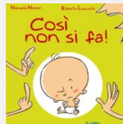
Così non si fa!